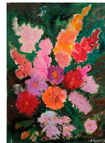
Annemarie Ewertsen Sonderausstellung 2025